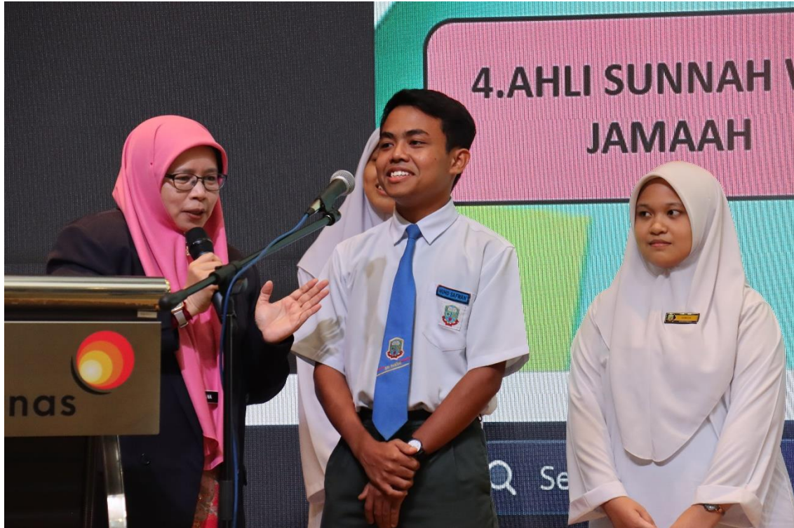
Sekitar sesi para pelajar bersama pakar subjek mata pelajaran di Program CSR Jejak Cemerlang 2024.